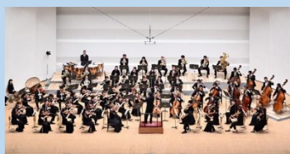
管弦楽 千葉交響楽団