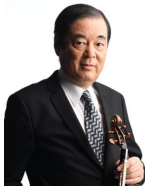
堀 正文 (指揮・ヴァイオリン) Masafumi Hori

5歳よりヴァイオリンをはじめ、京都市立堀川高校音楽科を経て、ドイツ・フライブルク音楽大学へ留学。在学中より、ハイデルベルク室内合奏団のソリストとして、ヨーロッパ各地への演奏旅行を行う。1973年、フランクフルト放送交響楽団とヴィエニャフスキ／ヴァイオリン協奏曲第1番を共演。1974年よりダルムシュタット国立歌劇場管弦楽団の第1コンサートマスターに就任。ヨーロッパ各国でオーケストラ活動はもとより、ソロ、室内楽などに幅広く活躍した。1979年、東京でのNHK交響楽団とのチャイコフスキーのヴァイオリン協奏曲共演が大きな反響を呼び、同年9月NHK交響楽団にコンサートマスターとして入団。以来35年間の長きにわたり楽団を牽引し、2015年名誉コンサートマスターに就任。数多くのソロ・リサイタルや室内楽に幅広く活躍している。また、N響での功績に対して有馬賞を受賞している。その他、ジュネーヴ国際音楽コンクール、レオポルト・モーツァルト国際ヴァイオリンコンクール、シュポア国際コンクールの審査員を務め、桐朋学園大学で後進の指導にあたるなど、日本クラシック界を代表するヴァイオリニストとして精力的な活動を繰り広げている。